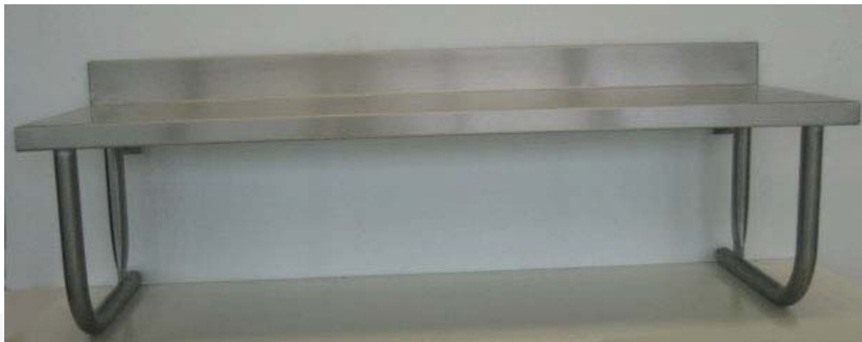
TABLE SUSPENDUE TENDANCE